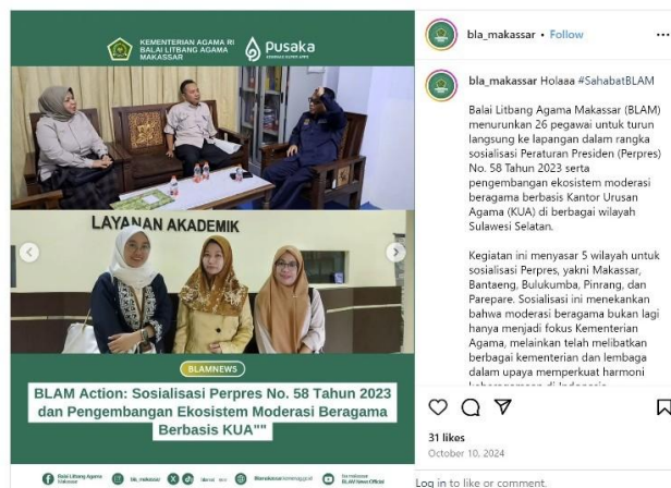
Gambar 4 Publikasi di Media Digital Sosialisasi Peraturan Presiden Nomer 58 Tahun 2023

https://www.instagram.com/p/DA8ONQfBJpB/?utm_source=ig_web_copy_link&igsh=MzRIODBiNWFIZA==