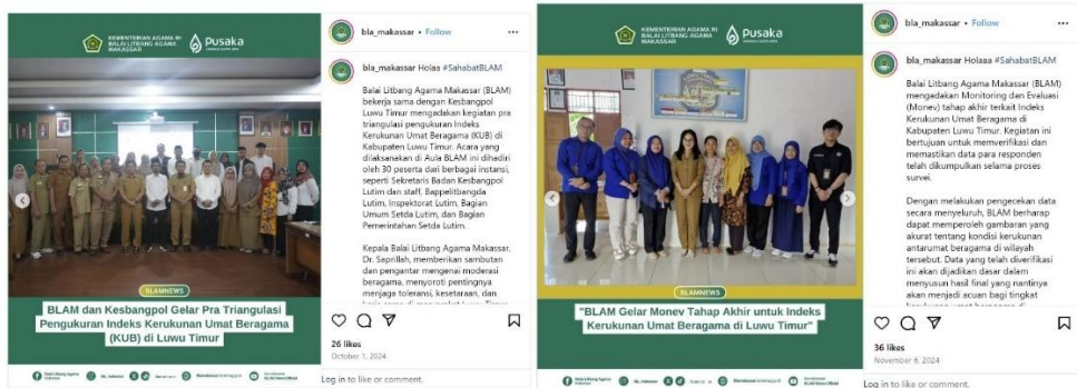
Gambar 1 Publikasi di Media Digital Pengukuran Indeks KUB

https://www.instagram.com/p/DCAAtA3-hR0/?utm_source=ig_web_copy_link&igsh=MzRIODBiNWFIZA==