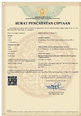
Gambar 2 HaKI