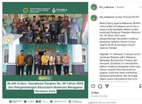
Gambar 3 Publikasi di Media Digital Advokasi Pengembangan Ekosistem MB berbasis KUA