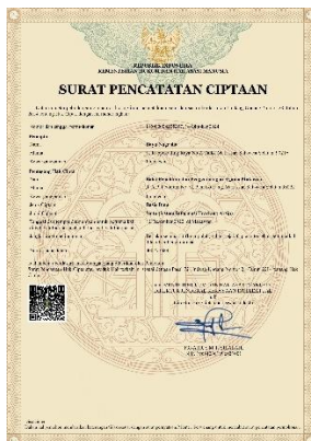
Gambar 5 HaKI