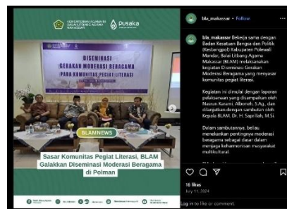
Gambar 6 Publikasi di Media Digital Advokasi Pengembangan MB di Madrasah dan MA

4. Sasaran Kegiatan Meningkatnya hasil penelitian pengembangan dan pengkajian kebijakan Lektor dan Khazanah Pendidikan Keagamaan, dengan indikator kinerja kegiatan :