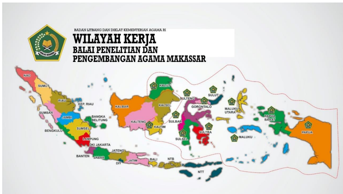
Gambar 2 Peta Wilayah Kerja Balai Penelitian dan Pengembangan Agama Makassar